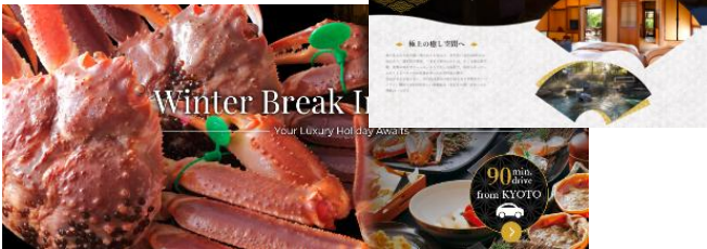
▲海外向けウェブ広告

し、京丹後の魅力や宿泊予約ページへの誘導を図っています。広告配信の閲覧数や反応なども分析し、より効果的な広告宣伝を目指しています。