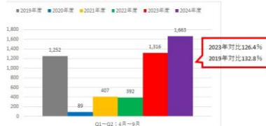
各年度同時期までの集計：4月~9月【外国人】