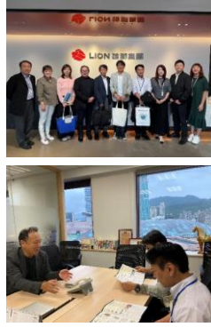
▲台湾旅行会社訪問の様子

2024年度観光庁の地域観光新発見事業の1つとして、台湾のCHR企業及び旅行会社への販路開拓につなげるプロモーション営業を目的に、11月5日（火）～11月7日（木）の3日間、台湾を訪問しました。