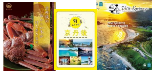
▲各種観光パンフレット

冊数に限りがありますが、宿泊施設等で配布をご希望の会員様には、お渡ししています。