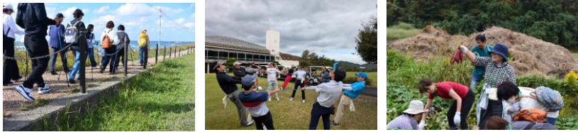
▲「ヘルスツーリズムモニターツアー」の様子

向けモニターツアー」を11/30（土）、12/1（日）＜参加者4名＞で実施しました。今年度、観光庁地域観光新発見事業の採択を受けた取組みです。本市内の宿泊施設や体験施設などの観光コンテンツを体験していただくことにより、京丹後市への誘客を図ろうとするものです。