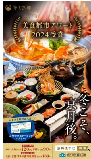
▲'冬'の観光プロモーション