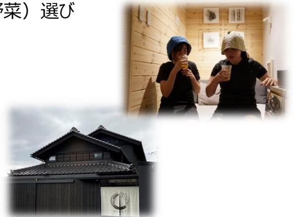
10/25 サウナ体験のイメージ