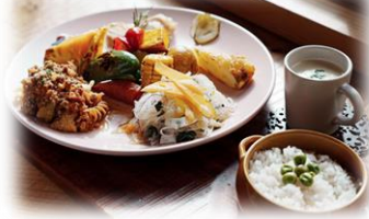
レストランでのランチ（イメージ）